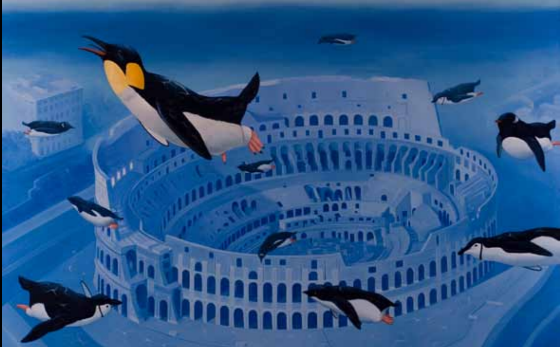
Claus Larsen »Den sidste Kejser« 100 x 150 cm Olie på lærred · 2011