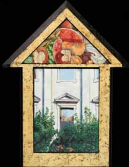
Ricki Klages »Copped Hall Shrine« 63,5 x 48,5 cm Olie på træ · 2011