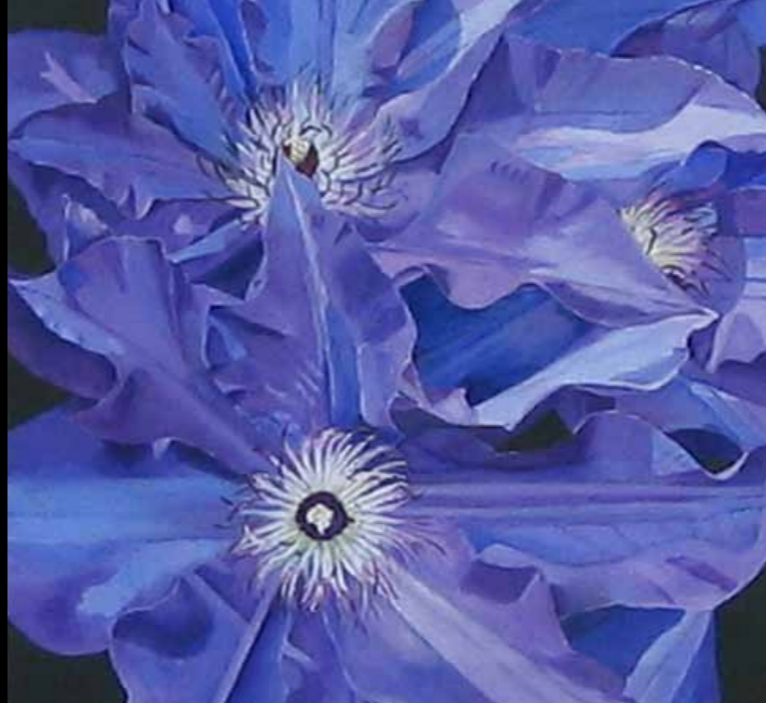
Dan Frøjlund »Jaffe Olympic One« 83 x 100 cm Acryl på lærred · 2011