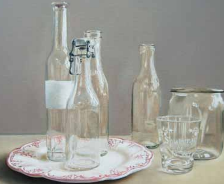
Jeanette Elmelund »Glas og flasker« 65 x 81 cm Olie på lærred · 2009