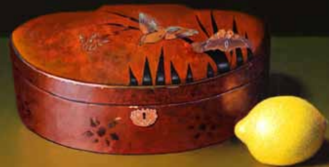
Niels Erik Skovballe »Opstilling med gammelt kinesisk skrin og en citron« 41,5 x 53,5 cm Olie på plade · 2011