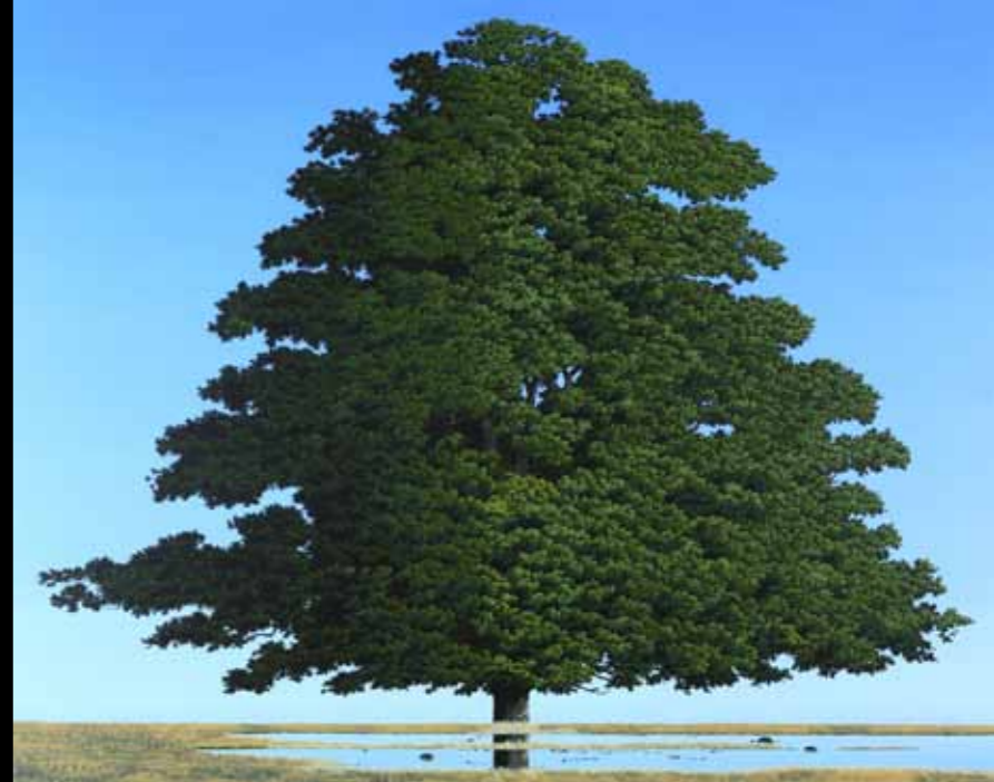
Søren Ludvigsen »Sommer i dyrehaven« 130 x 160 cm Acryl på lærred · 2011