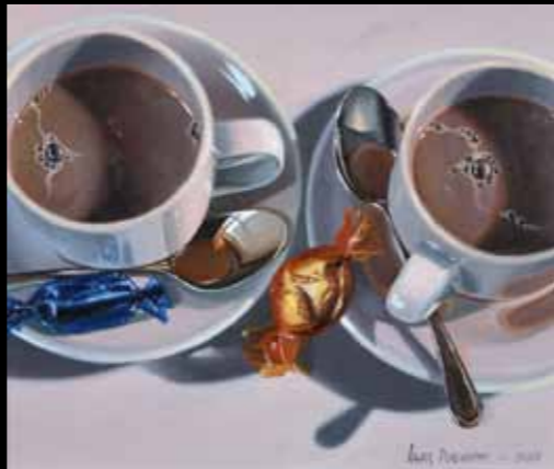
Lars Pugholm »Café liv« 23 x 28 cm Olie på lærred · 2011