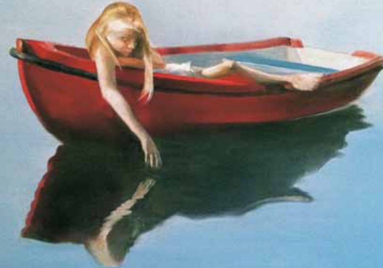
Elin Engelsen »Emma« 150 x 150 cm Olie på lærred · 2011