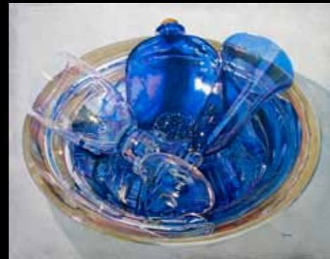
Lorena Kloosterboer »Sapphire Blue« 55 x 71 cm Acryl på lærred · 2011