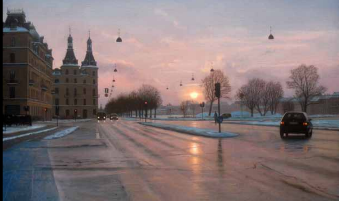
Daniel Goldenberg »Søtorvet, vinter eftermiddag« 75 x 100 cm Olie på plade · 2011

Forsidebillede: Tommy TC Carlson · »The party is over« 180 x 80 cm · Olie på plade · 2011