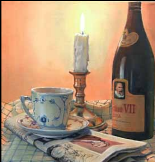
Vita Nete Pedersen »Eventyr på spil« 40 x 40 cm Olie på lærred · 2011