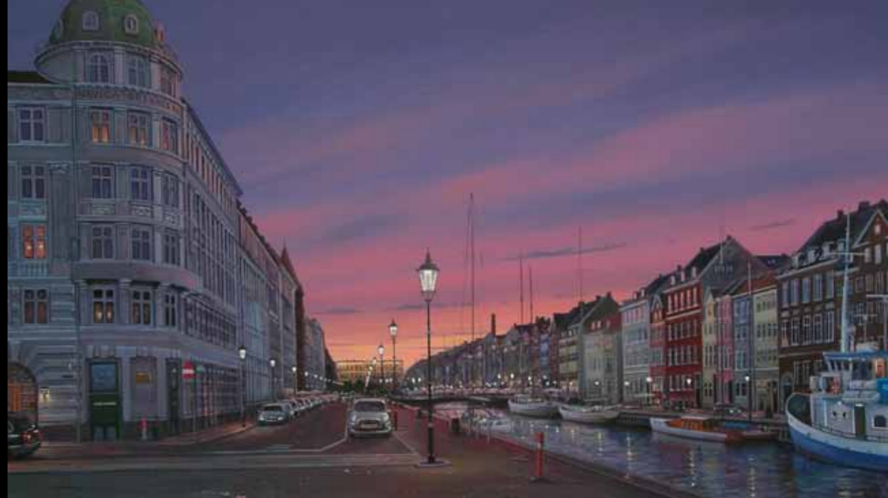
Roelof de Roo »Nyhavn, sommeraften« 80 x 120 cm Olie på lærred · 2011