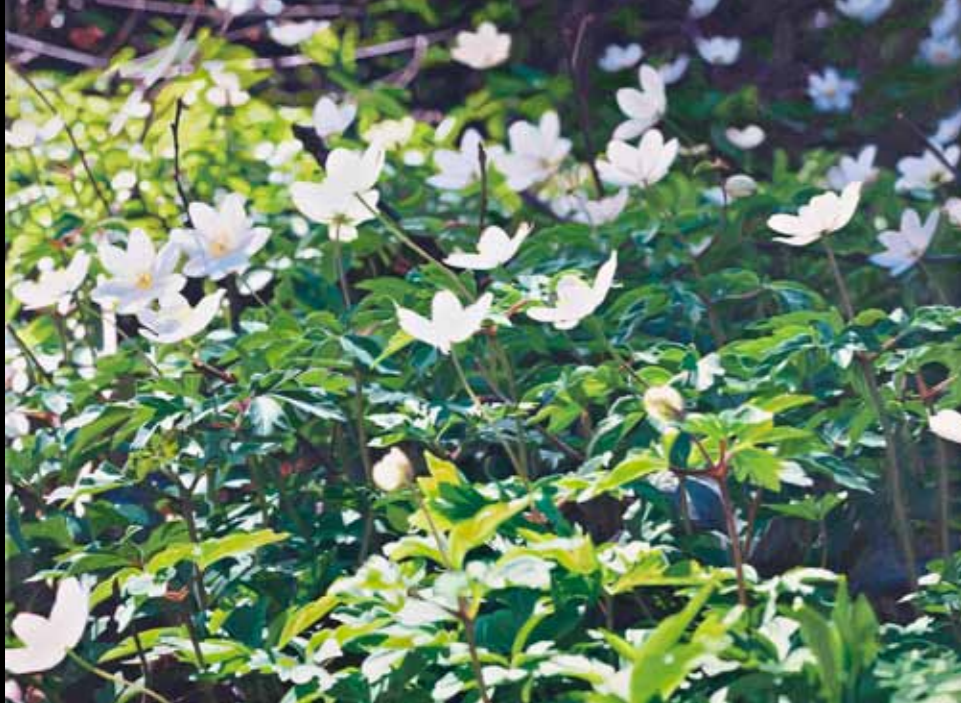
Bodil Schmidt »Forår, anemoner i Krabbesholm skov« 70 x 90 cm Acryl på lærred · 2011