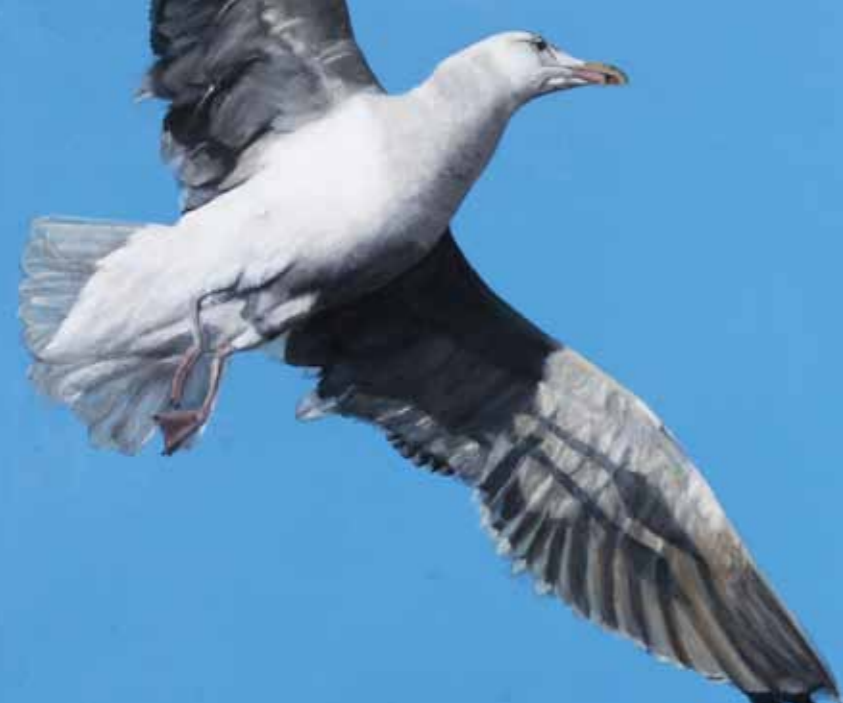
Lone Reich »Måge i flugt« 46 x 55 cm Acryl på lærred · 2009