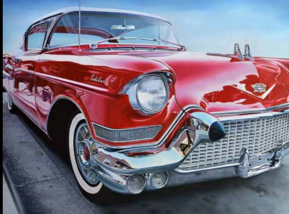
Michael Schuh »Classic Cadillac Reflections« 80 x 100 cm Olie på lærred · 2011