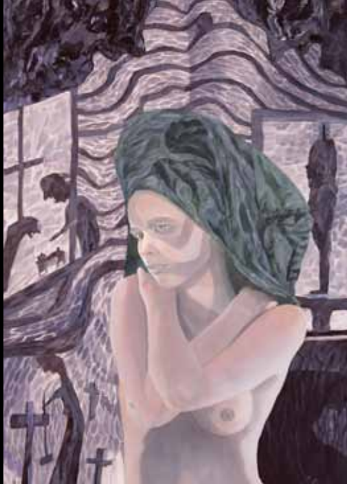
Peter Elver »Charlottes tanker« 85 x 58 cm Olie på lærred · 2011