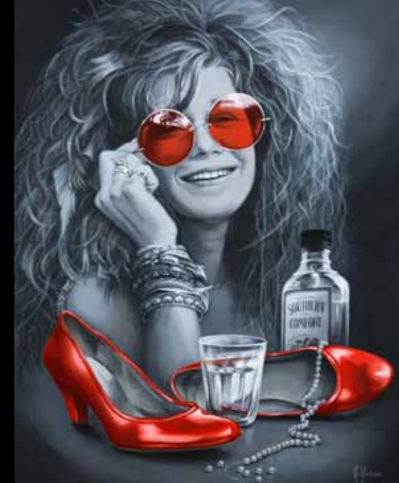
Sanne Glissov »Pearl« 90 x 70 cm Olie på lærred · 2011