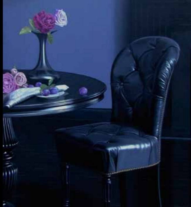
Jørn Møbius »Opstilling med roser og blå blomster« 100 x 80 cm Olie på lærred · 2011