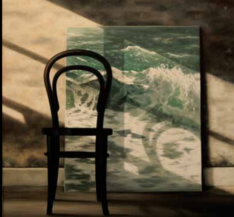
Mette Nørregaard »Ingen tid at spille« 80 x 80 cm Olie på lærred · 2011